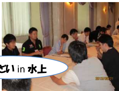
選挙について議論