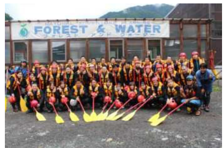
チームワークで激流を制覇